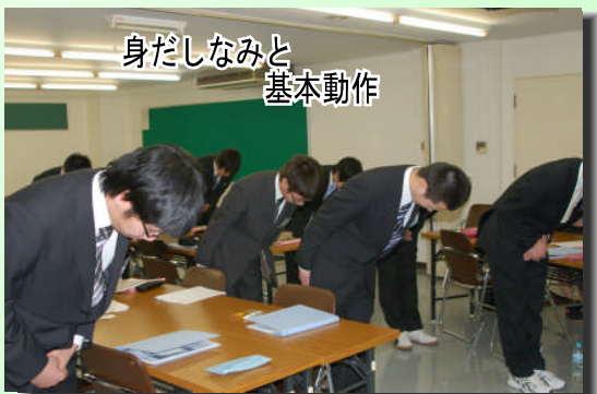
身だしなみと基本動作