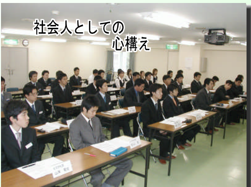
社会人としての心構え